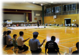
(中学校区の地区懇談会)