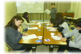
(公民館での家庭教育講座)