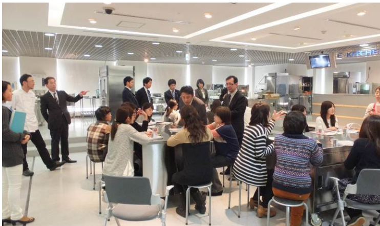
参加者同士も交流が深まりました