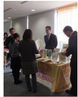
興味をもった各メーカーの営業担当者と直接話すことができました