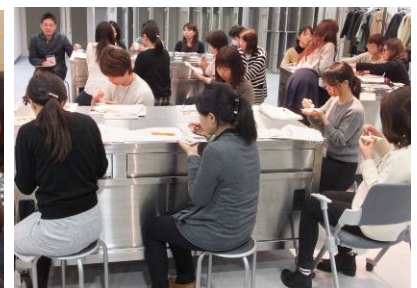
ひと口ひと口、確かめるように試食