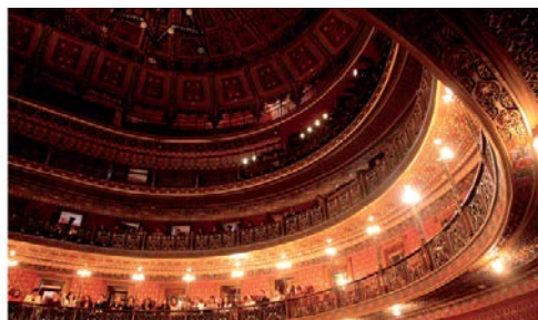
国際芸術祭の会場の一つファレス劇場