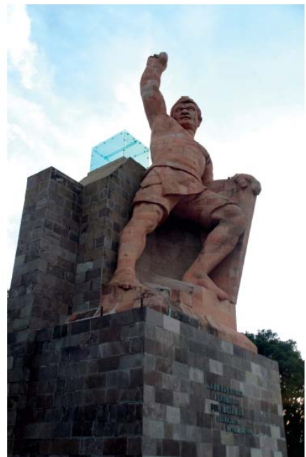
独立戦争の英雄 ピピラ像

【民芸品】 ゴルキー・ゴンザレス作の色絵陶器(マジョルカ焼)，銀製品など多彩な民芸品 ※ゴルキー・ゴンザレス：伝統的な色絵陶器(マジョルカ焼)を復興した陶芸家 メキシコの国民栄誉賞を受賞 日本で辻清明と藤原啓(重要無形文化財保持者)のもとで修行