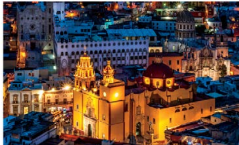
世界遺産であるグアナファトの市街地