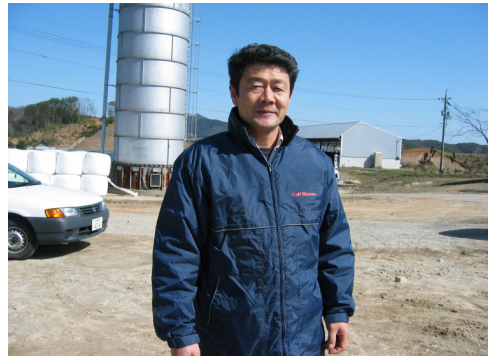
社長が作っています