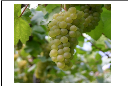
セミヨン(ワイン原料ぶどう)