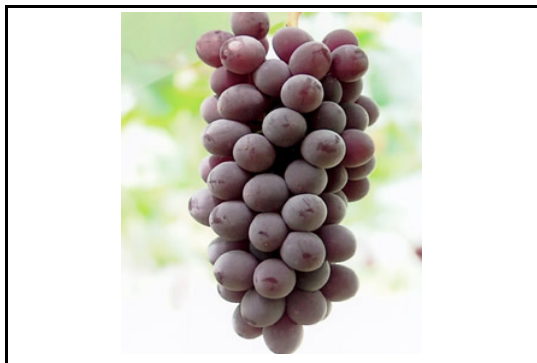
キングデラ(ぶどう)