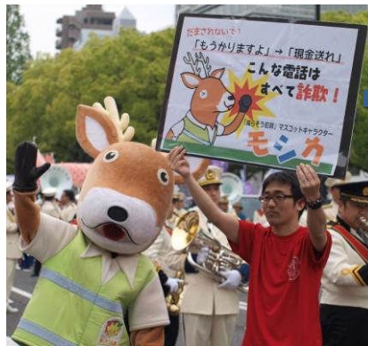
「現金送れはすべて詐欺！」