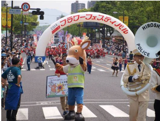
多数の来場者で大にぎわいでした！

多くの来場者でにぎわうパレード会場でも、モシカは子どもから高齢者の方まで大人気でした。このパレードには反射材利用促進キャラクターの「キラリ☆マン」も登場し、交通安全を呼びかけました。