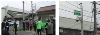
八本松駅前防犯カメラ落成式