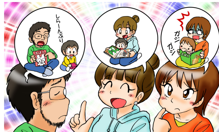
イラスト：うじな かずひこ

絵本の読み聞かせは、赤ちゃんにとって、大好きなお父さん、お母さんや家族の肌のぬくもりを感じ、心地よいことばのひびきの中に包まれる心安まるひとときです。親にとっても、赤ちゃんのすてきな表情を通して子育ての楽しさを感じるひとときでしょう。