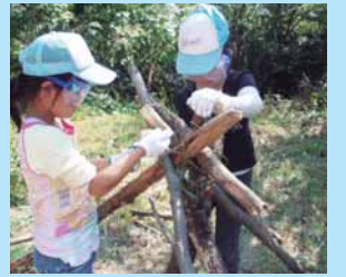
みんなで家作りにチャレンジ!

〈申し込みは往復ハガキで〉 ●受付開始 8月1日(水) ●受付終了 8月15日(水) 当日消印有効