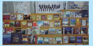
見るだけで旅行気分になれるような展示

広島空港の定期路線は、国内線5路線、国際線6路線が運行しています。広島空港からの空の旅をより一層楽しめるよう、国内線・国際線の就航地に関する資料や、飛行機に関する資料等を展示・貸出し、パンフレットを配布します。