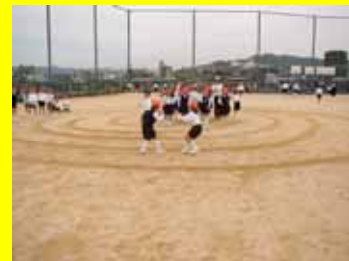
昔遊びを先生から習って