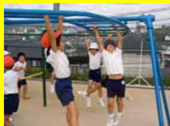
固定遊具で夢中になって

開校当初から実施(本年度から月2回実施)。子どもたちの「遊び」を見直し、遊びを通して様々な身体感覚や運動感覚、仲間との豊かな人間関係を築くことをねらいとしている。